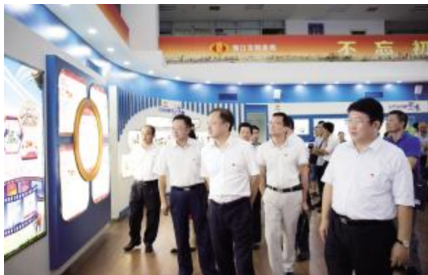
省委常委、秘书长、省直机关工委书记胡光辉等领导参观海口市税务局“机关党建示范点”

学在实处、学在深处、学在新处,关键是在理论联系实际深思细研,融会贯通。省直机关各单位在培训过程中,紧紧围绕十二个重点产业、“五网”基础设施、乡村振兴战略、六大专项整治、民生事业等谋划项目,科学设置专题,专家学者紧密结合海南实际,对学习贯彻习总书记重要讲话和中央 12 号文件精神进行了深入解读和阐释。“学习越深入,对习总书记讲话的理解越深刻,对建设自贸区(港)的信心更强了!”省直机关广大党员干部职工纷纷表示。