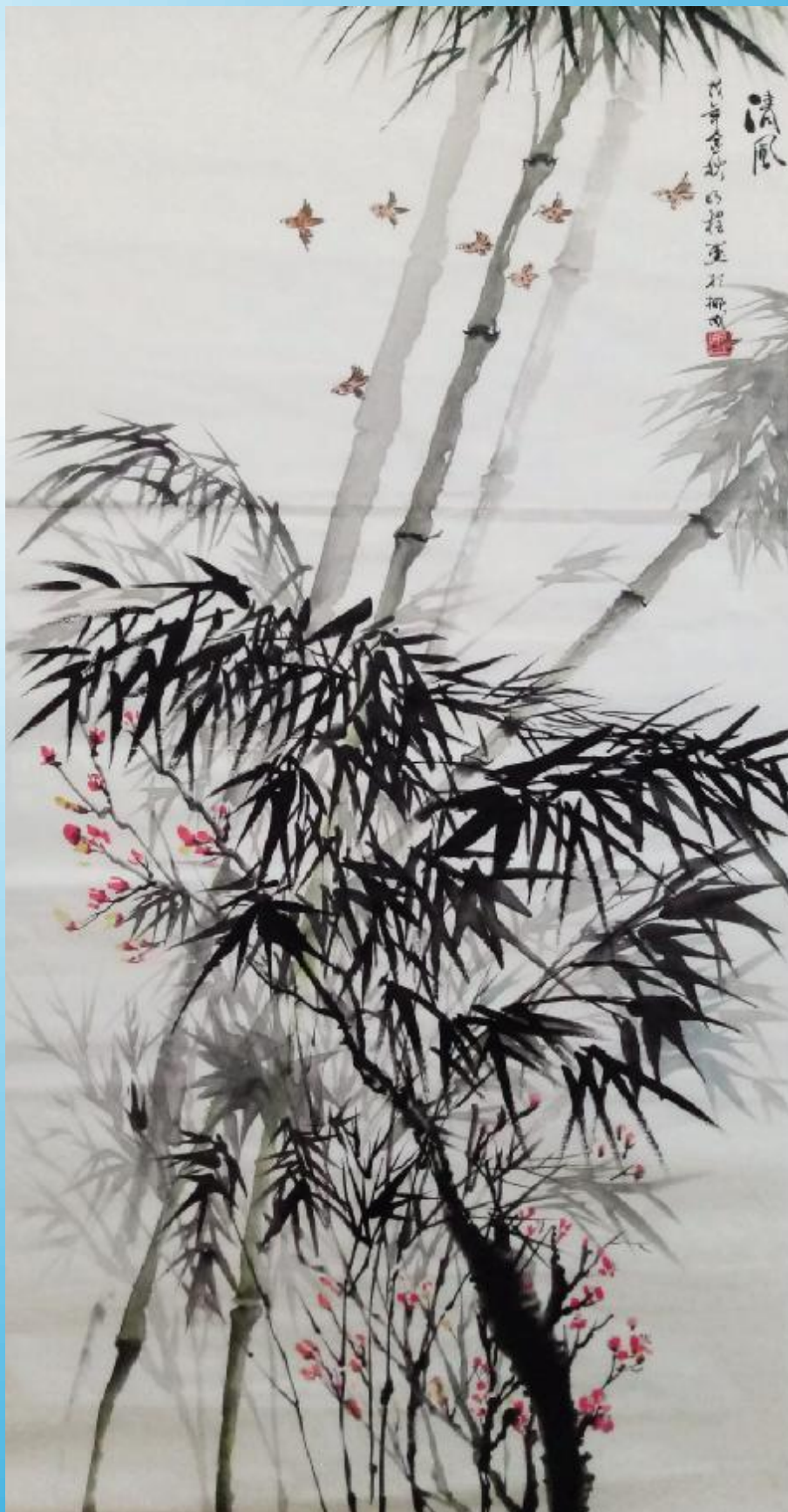
清風 作者：边检总站 黄明程

《海南机关党建》地址：海南省海口市国兴大道69号海南广场9号楼1808室(省直机关工委党建研究室) 电话(传真)：(0898)65330729 邮箱：h njgdj@163.com