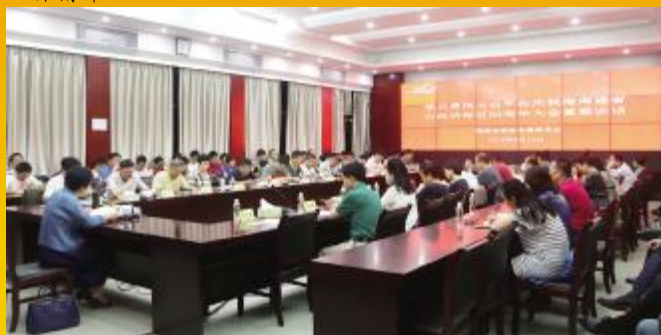
省旅游委传达学习习近平在庆祝海南建省办经济特区30周年大会重要讲话精神