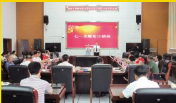
省地震局开展纪念建党 97 周年主题党日活动