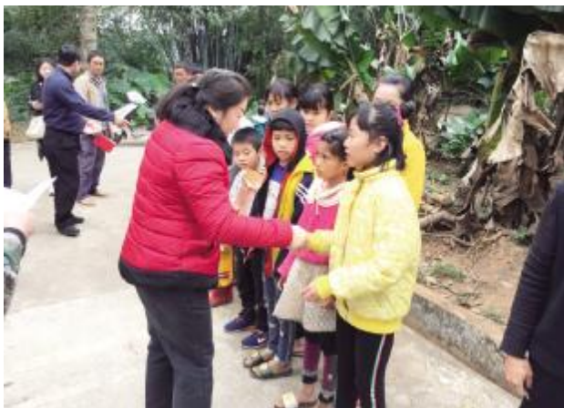
省财政厅国库支付局教科文二站党支部组织党员赴乐调村开展扶贫攻坚活动

学深悟透,烂熟于胸,从更高的政治站位谋划贯彻落实举措。深入研究讲话内容和中央指导意见,找出习总书记重要讲话和中央指导意见对国土资源工作的新要求新部署,认真查找能力素质与讲话和指导意见之间存在的差距,进一步解放思想,强化学习领会,确保学习全覆盖;谋定而后动,以“功成不必在我”的精神境界和“功成必定有我”的历史担当,全面梳理重要讲话和指导意见,列出使命清单,明确目标任务。从内部管理运行的程序入手,克服形式主义和官僚主义,提高效率。以国际化、专业化的理念坚定不移地贯彻落实习总书记讲话和中央指导意见,迅速建立统计上报制度,摸清楚全系统自然资源资产的底数。