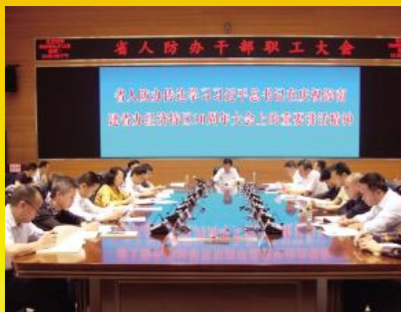
省人防办传达学习习近平总书记重要讲话和中央12号文件精神