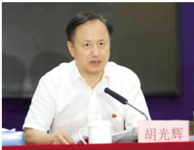
省委常委、秘书长、省直机关工委书记胡光辉部署全省机关党建工作

“经济特区不仅要继续办下去，而且要办得更好、办出水平。”在庆祝海南建省办经济特区 30 周年大会上，习近平总书记高度肯定海南经济特区改革发展事业取得的重要成就，并对新时代进一步办好经济特区提出明确要求。