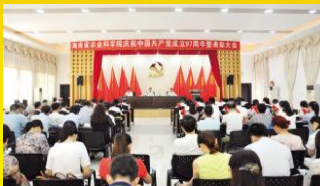
省农科院召开庆祝中国共产党成立 97 周年暨表彰大会

省直机关各级党组织以改革开放为主题,分专题、有计划、多层次地系统学习和深刻领会习近平总书记 4·13 重要讲话、中央 12 号文件和省委七届四次全会精神实质。将主题党日活动与庆祝中国共产党成立 97 周年、海南建省办经济特区 30 周年纪念活动相结合,与开展“大学习、大提升”活动相结合,推动机关广大党员干部大力弘扬特区精神,坚决打赢脱贫攻坚和污染防治攻坚战,在建设海南自贸区(港)中立足岗位做贡献、勇于担当做表率。通过主题党日活动,推进基层党组织建设,提升组织力,为全面深化改革开放和扶贫攻坚提供坚强的组织保障;致力于转变思想观念和工作作风,切实解决好本领恐慌、干部作风、营商环境、工作方法等四个方面的问题,敢于突破利益固化藩篱,在全面深化改革开放中充分发挥先锋模范作用,为推动海南自贸区(港)建设埋头苦干,履职尽责。