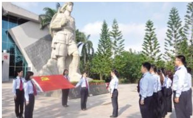
琼海税务局组织党员干部到红色娘子军革命纪念馆重温入党誓词

学之愈深、知之愈明、行之愈笃,学习宣传贯彻习近平总书记重要讲话和中央 12 号文件精神的热潮汇聚起争创新时代中国特色社会主义生动范例的强大正能量。省高级人民法院、省检察院、省科技厅、省工业和信息化厅、省环境保护厅、省农业厅、省文体厅等省直单位结合机关实际,学以致用,先谋后动,推动学习成果的运用转化。机关广大党员干部职工大力弘扬敢闯敢试、敢为人先、埋头苦干的特区精神,紧紧围绕建设全面深化改革开放试验区、国家生态文明试验区、国际旅游消费中心、国家重大战略服务保障区的国家战略定位,抓住推动海南自贸区(港)建设的重大机遇,以全面深化改革和推进自主创新为根本动力,以“一天当三天用”的工作状态,统筹推进种业、医疗、教育、体育、电信、互联网、文化、维修、金融、航运等重点领域,深化现代农业、高新技术产业、现代服务业对外开放,推动服务贸易加快发