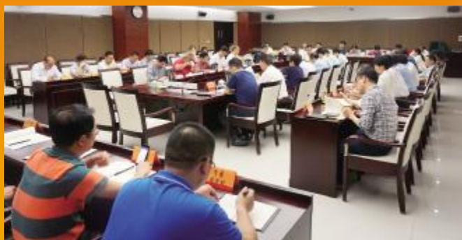
省政府办公厅传达学习习近平总书记重要讲话和中央12号文件精神

按照省委部署,省直机关单位各级党组织采取多种形式,原原本本传达学习习近平总书记在庆祝海南建省办经济特区30周年大会上发表的重要讲话和《中共中央国务院关于支持海南全面深化改革开放的指导意见》(下称“中央12号文件”)精神,迅速掀起全面落实好习总书记重要讲话和中央12号文件精神热潮。省直机关全体干部职工表示,要以建省办经济特区30周年为新起点,坚定不移全面加强党的建设,坚定不移深化改革开放,坚定不移推动经济高质量发展,坚定不移加强生态文明建设,坚定不移保障和改善民生,坚定不移实施人才强省战略,努力在贯彻习近平新时代中国特色社会主义思想、实现“两个一百年”奋斗目标和中华民族伟大复兴中国梦体现海南新担当,体现新时代的新作为新亮点,再创经济特区新辉煌。