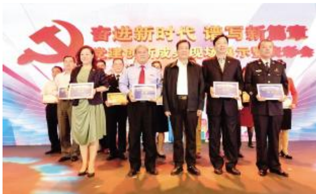
海口税务局微电影《特殊考验荣获全国党建创新案例文化创意组金奖

四是抓好培训研讨和学习辅导。 省委组织部、省直机关工委、省社科联、海南调查总队、省旅游委等单位结合实际,采取集中轮训、组织研讨班、举办讲座报告会等形式,对党员干部职工进行专题培训。主动邀请省内外专家学者,为本单位全体党员干部职工开展集中宣讲辅导,帮助党员干部解惑释疑、深化理解,确保党员干部原汁原味研读习总书记重要讲话和指导意义,学深悟透习总书记重要讲话和指导意义中蕴含的新理念、新目标、新部署,进一步推动理念创新、工作创新,着力提高学习贯彻的成效。在培训的方式方法上加强与党员干部职工的互动交流,充分利用网络平台和渠道,组织举办知识测试、竞赛、问答活动,增强了党员干部参与全面深入学习贯彻习总书记重要讲话和中央 12 号文件精神的自觉性和主动性。