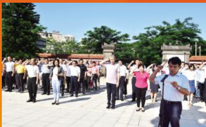
省民政厅组织厅机关党员赴琼崖红军云龙改编旧址开展“七一”党日活动

刘赐贵书记强调,全省党员干部要在实际工作中勇当先锋、做好表率。要在坚定践行“四个意识”方面勇当先锋、做好表率;在大力弘扬敢闯敢试、敢为人先、埋头苦干的特区精神上勇当先锋、做好表率;在着力营造法治化、国际化、便利化的营商环境方面勇当先锋、做好表率;在坚决打赢脱贫攻坚攻坚战上勇当先锋、做好表率;在坚持问题导向、破除体制机制弊端方面勇当先锋、做好表率;在实施好“百万人才进海南行动计划”方面勇当先锋、做好表率;在持之以恒正风肃纪反腐方面勇当先锋、做好表率。