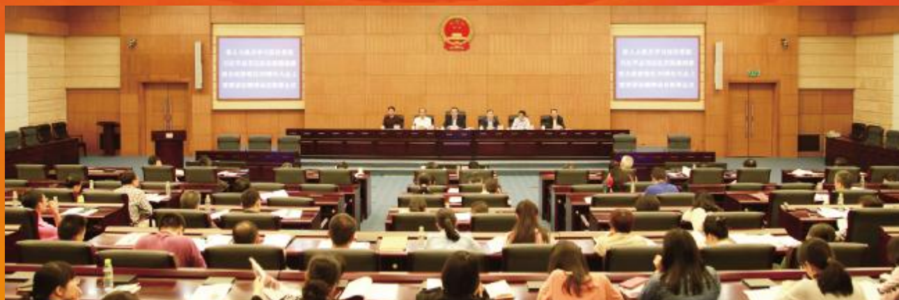
省人大传达学习习近平总书记重要讲话和中央12号文件精神

按照省委部署,省直机关单位各级党组织采取多种形式,原原本本传达学习习近平总书记在庆祝海南建省办经济特区30周年大会上发表的重要讲话和《中共中央国务院关于支持海南全面深化改革开放的指导意见》(下称“中央12号文件”)精神,迅速掀起全面落实好习总书记重要讲话和中央12号文件精神热潮。省直机关全体干部职工表示,要以建省办经济特区30周年为新起点,坚定不移全面加强党的建设,坚定不移深化改革开放,坚定不移推动经济高质量发展,坚定不移加强生态文明建设,坚定不移保障和改善民生,坚定不移实施人才强省战略,努力在贯彻习近平新时代中国特色社会主义思想、实现“两个一百年”奋斗目标和中华民族伟大复兴中国梦体现海南新担当,体现新时代的新作为新亮点,再创经济特区新辉煌。