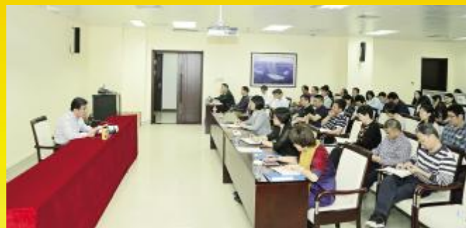
省外事侨务办传达学习习近平总书记重要讲话和中央12号文件精神